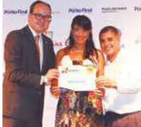
Topa Tudo: Topa Tudo Catete