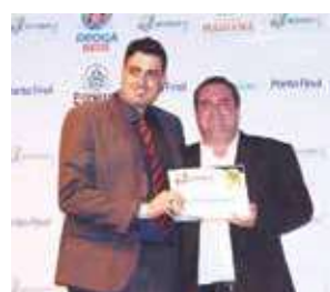
Eletrônica de Rádio e TV: Eletrônica Pontual