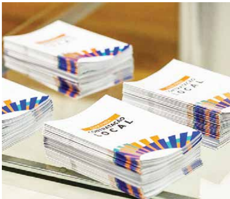
A ação faz parte da política de contratação de fornecedores.

Os processos são concorrenciais e sempre será contratado o melhor preço. Além disso, os fornecedores precisam ter capacidade técnica e saúde financeira. Com esses requisitos, os interessados também podem acessar o site oficial da Fundação Renova