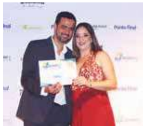
Decoração de Festa Infantil: Tindolelê Festas