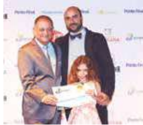
Turismo e Transporte: Indaiá