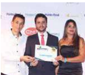
Empresa de sonorização: Saturno Produções