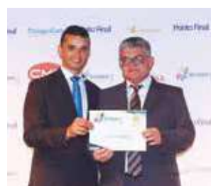
Artigos Esportivos: Cunha Esportes