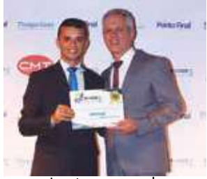
Lanternagem de automóveis: Impercar