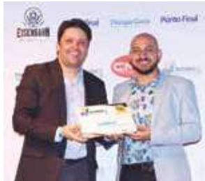
Loja de roupa masculina: Rota 13