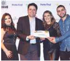
Loja de cosméticos: Maria Bonita