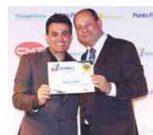
Escola de Nível Superior: FAMA