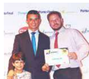
Haras: Haras Dulico