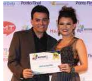
Maquiadora: Natália Passos