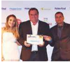
Funerária: Funerária São José