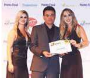
Estúdio de Pilates: Espaço Veppo