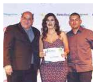
Calçados adulto: Dazz Calçados