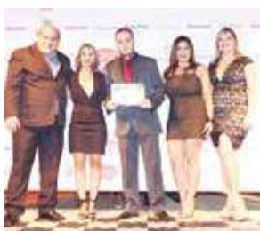
Loja de Açai: Summer Açai