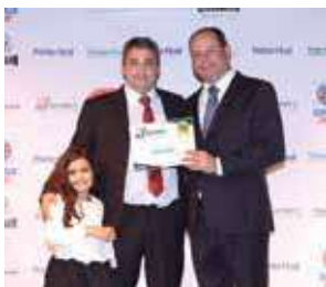
Espeteria: Spetu's Beer