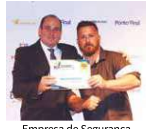
Empresa de Segurança Pessoal e patrimonial: Máxima Segurança