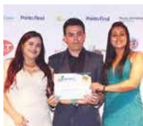
Comércio de ração e varejo: Recanto do Fazendeiro