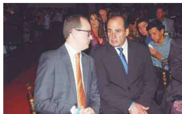
Nosso amigo e deputado Thiago Cota, muito assediado no destaque. O que não faltou foi uma boa prosa com o presidente da Câmara Fernando Sampaio.