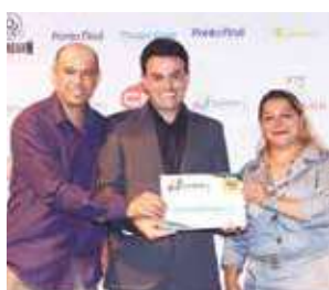
Distribuidora de água: União Gás