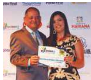
Acessórios femininos: Belíssima