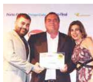
Material Elétrico: Eletromar