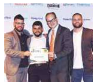
Quadra Society: Doze Society Bar