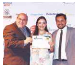
Fisioterapia Esportiva: Bio Sport