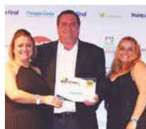
Material de Construção: Constrular