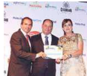
Clínica de Olhos: Clínica GMR Centro Médico