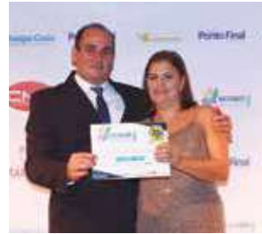
Hotel: Hotel Brasil