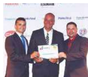
Farmácia: Drogaria Americana