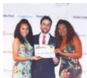
Agência de turismo: Agência Transnemém