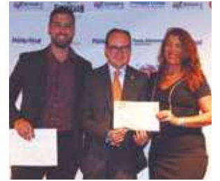
Loja de ferragens Agrícolas: Murici