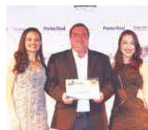
Consultoria Empresarial: Destaque-se