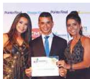
Boutique: Boneca de Pano