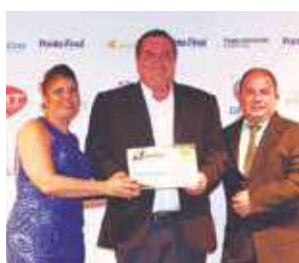
Loja de artesanato: CTL Presentes e Artesanatos