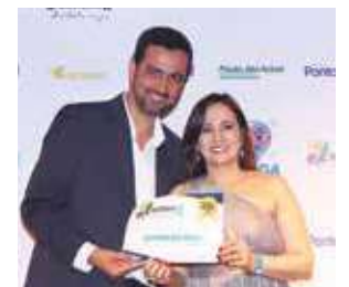
Cooperativa: Cooperativa de Crédito SICOOB Credimepi