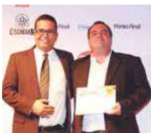
Emissora de Rádio Rádio Mariana