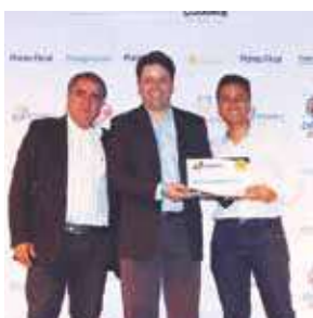
Empresa de Segurança Eletrônica: Vigiez