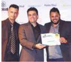
Empresa de Eventos: JS Produções