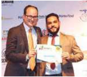
Loja de Pneus: Mariana Pneus