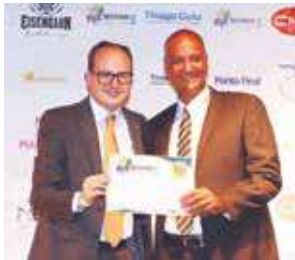
Entidade Sindical: Strop