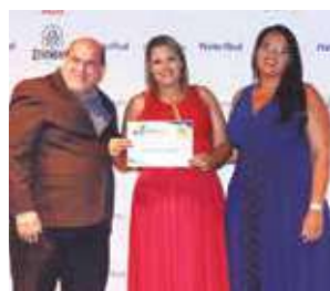
Buffet: Doce Sabor