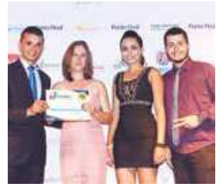
Imobiliária: Vila do Carmo