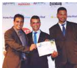
Fábrica de picolé: + Sabor