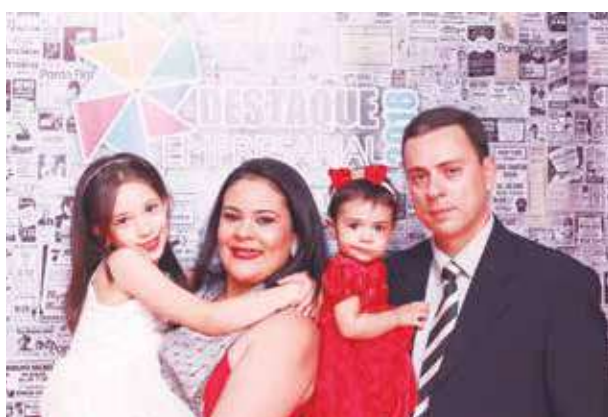
Vários estúdios fotográficos foram montados para o evento.