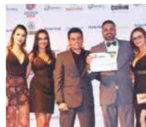
Clínica de Estética: Bem Estar