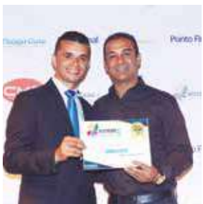
Empresa de ônibus coletivo: Transcotta