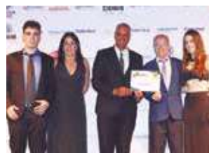
Loja de móveis: Azevedo