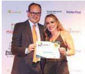
Loja mais bonita: Laçarote