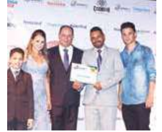
Lava jato: Lava jato Cabanas