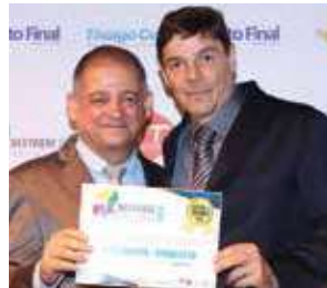
Arquiteto: Luís Carlos Gonçalves