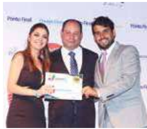
Loja de roupa feminina: Santa Flor