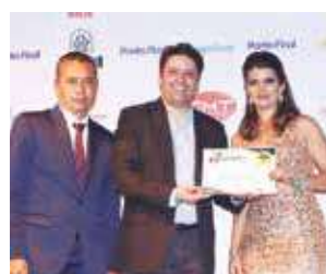
Loja de Noivas: Adriana Noivas