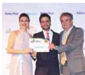
Escola Infantil: Colégio Flecha