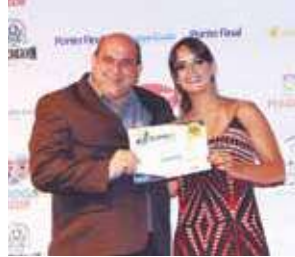
Loja de roupa infantil: Kilo Kids