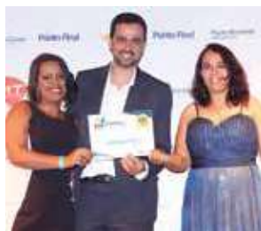
Padaria: Padaria Lafayette