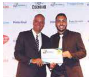
Banca de jornais e revistas: Banca Superinteressante