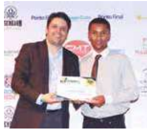
Estamparia e Pintura: Gênio Placas