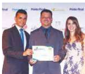
Pintor: Preto Pintor