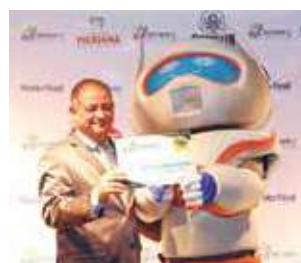
Provedor de internet: CMT - Conecta Minas Telecom