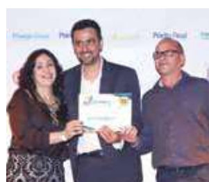
Melhor atendimento: Drogarede São Geraldo