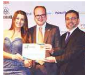
Clínica de Emadrecimento: Emagrecenter