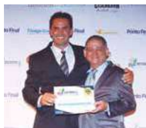
Floricultura: Recanto Verde