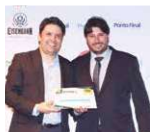
Distribuidora de Gás: Líder Gás