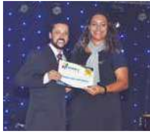
Som e Acessórios: Mariana Som e Acessórios