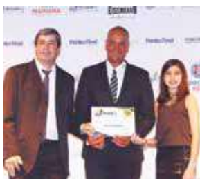
Aluguel de caçamba: Tele caçambas