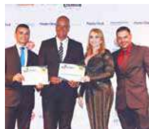
Autoescola: Autoescola São Cristóvão