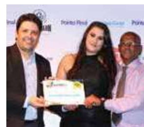
Restaurante: Barra Longa