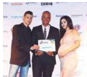
Serralheria: Serralheria Ferman