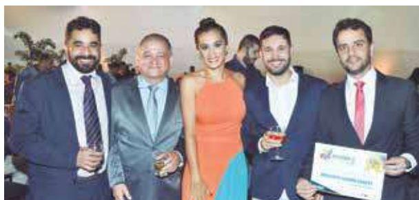
Tive a honraria de tirar fotos com vários amigos.