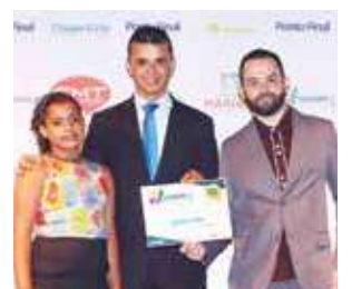
Salão: Salão Status