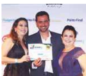
Escola de Idiomas: Wizard

Fotos disponíveis no Stúdio Élcio Rocha.