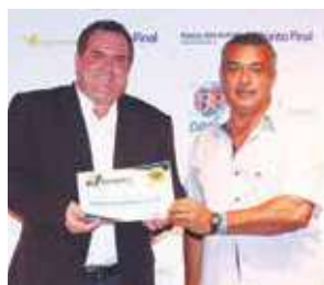
Clube: Centro de Vivência Del Rey CVDR