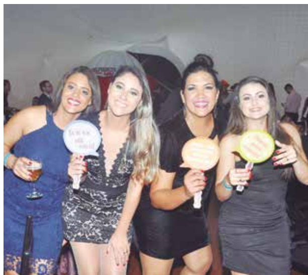
Atrativos que não podem faltar na maior festa de Mariana.