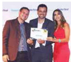
Loja de telefonia Celular: Paulista Cell