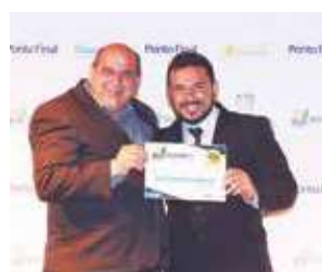
Agência de carros: Carlos Veículos