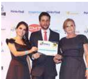
Sorveteria: Tradição de Minas