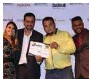
Formação (curso de soldagem): Senai