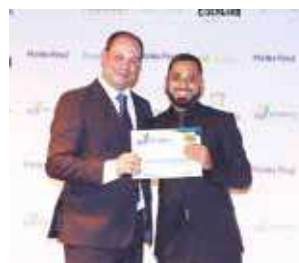
Mercearia (mini mercado): Comercial Boa Praça