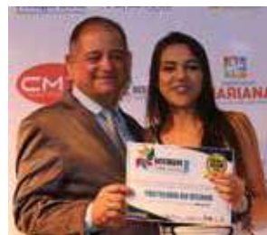
Pastelaria: Pastelaria do Vitinho