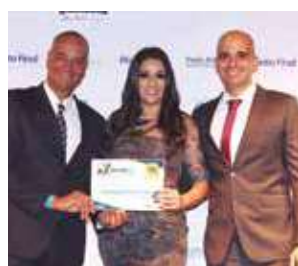
Academia: Sport Fitness