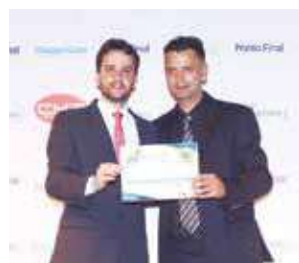
Açougue: Casa de Carne Santo Antônio