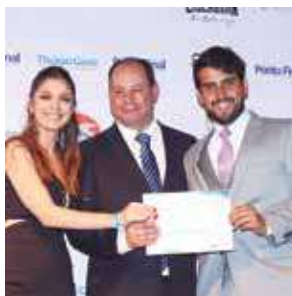
Supermercado: Varejão Popular