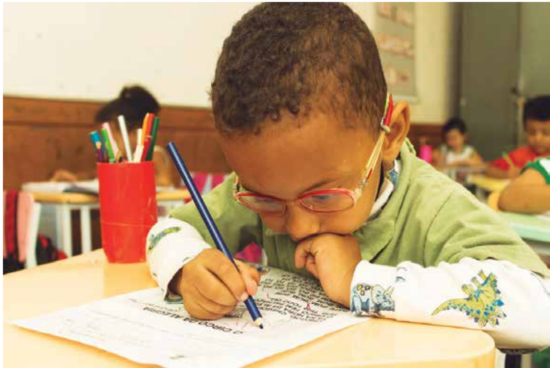
O município tem realizado adesão a programas implementados pela União.