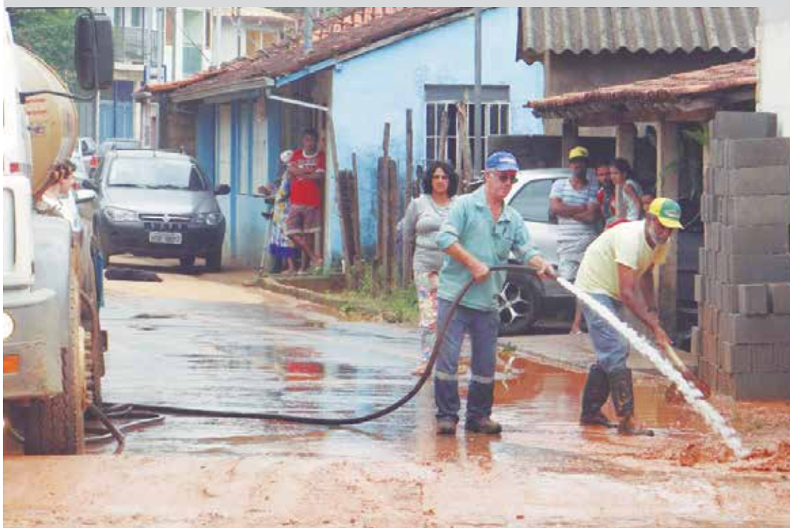
A água invadiu diversos imóveis do distrito.