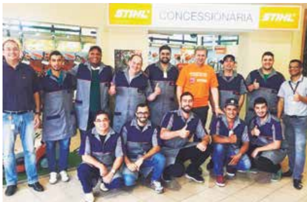
Murici Máquinas durante qualificação na Fábrica Stihl no RS. Equipe fera!