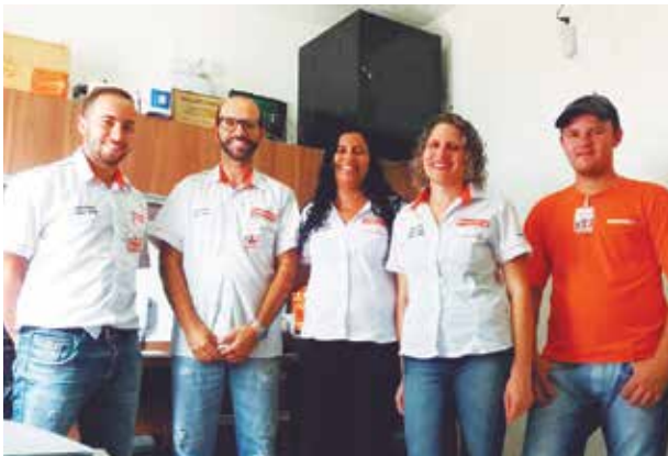
A equipe da Líder Gás sempre inovando. A cada semana tem sorteios para seus clientes. Não fique fora dessa!