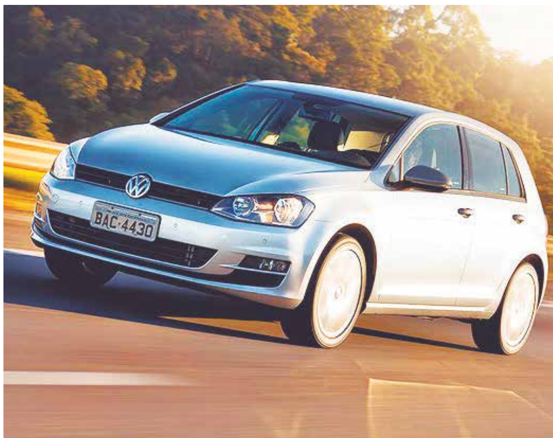
O Golf MSI estreou início de 2016.