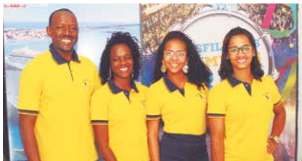
Na Transneném cada dia é uma novidade. Agora se destacando com o novo uniforme. Sucesso sempre!