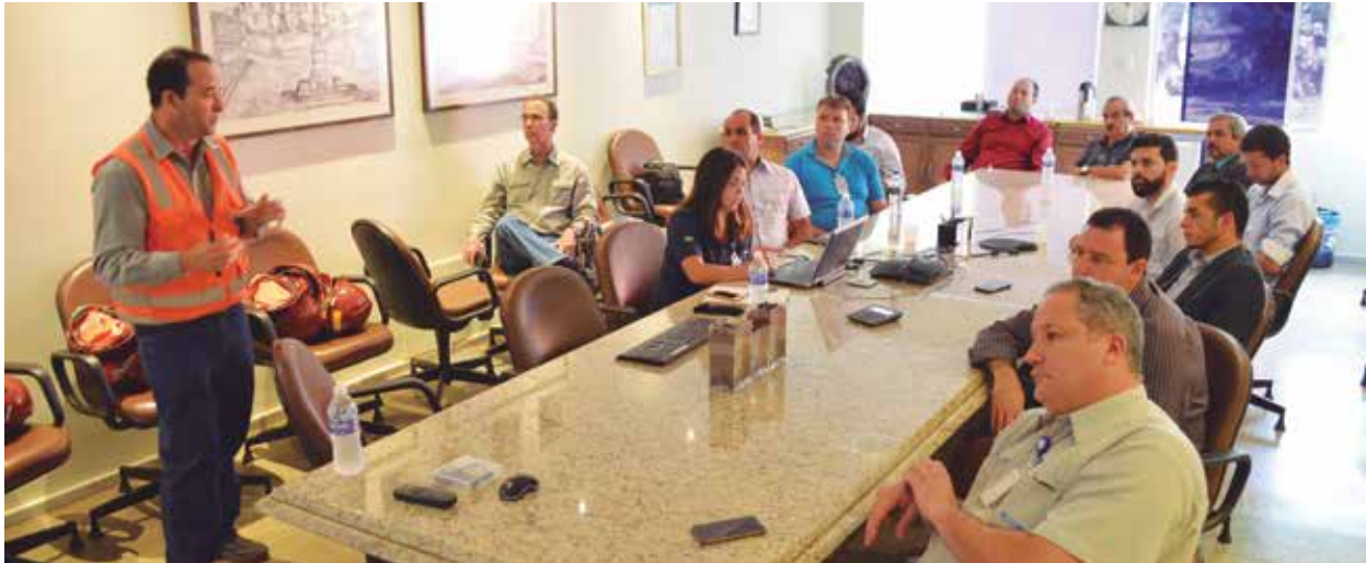
Os parlamentares acompanharam a prestação de contas da mineradora sobre as ações já executadas.

Medidas. Entre as iniciativas, além de contenções e ações de segurança, está a implantação do Centro de Monitoramento e Inspeção da empresa.