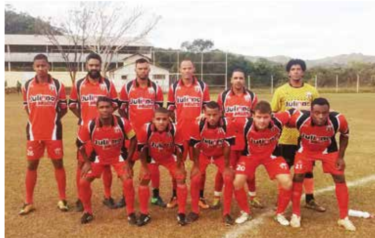
Na foto, a equipe do bandeirantes.

Portanto teremos no próximo final de semana os jogos finais do Futebol de Mariana da 2ª