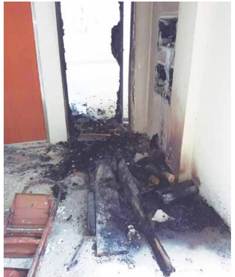
Condomínio é alvo de vandalismo e ameaça segurança de família.

Um dos motivos da falta de habitação no local, segundo a