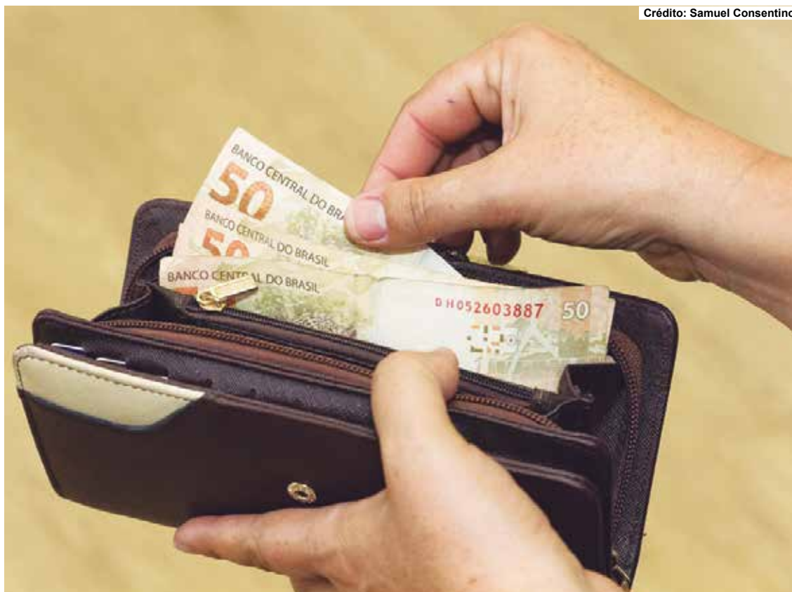
O recurso estará disponível para saque já no próximo dia 11 de outubro.