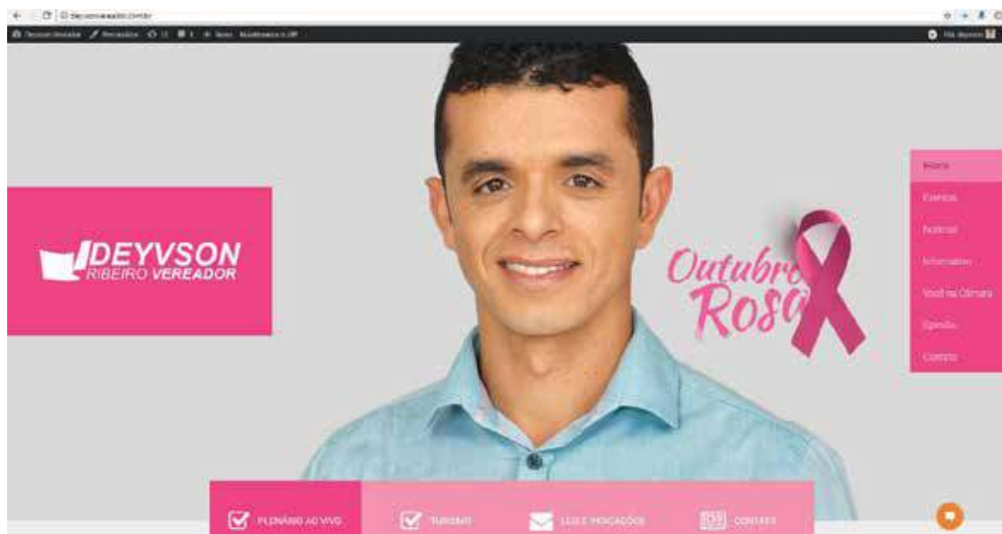
Interface do site do vereador Deyvson Ribeiro (SD).

“Apesar de que a doença esteja presente o ano inteiro, o mês de outubro foi escolhido para representar