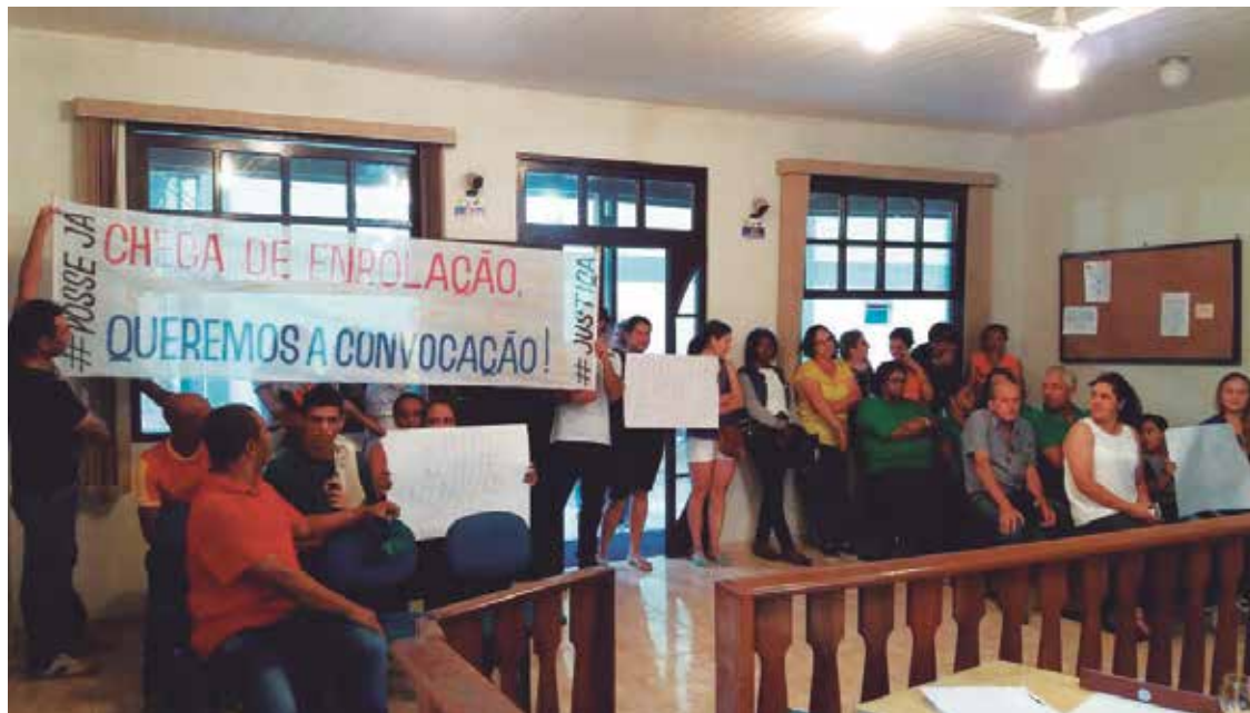
Na segunda-feira (2) foi realizada uma manifestação no plenário da Câmara Municipal.

Impasse. Município alega que não tem verba para empossar, mas contratou 90 cargos.