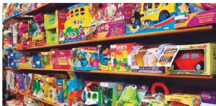
A expectativa é de piora em relação a 2016.