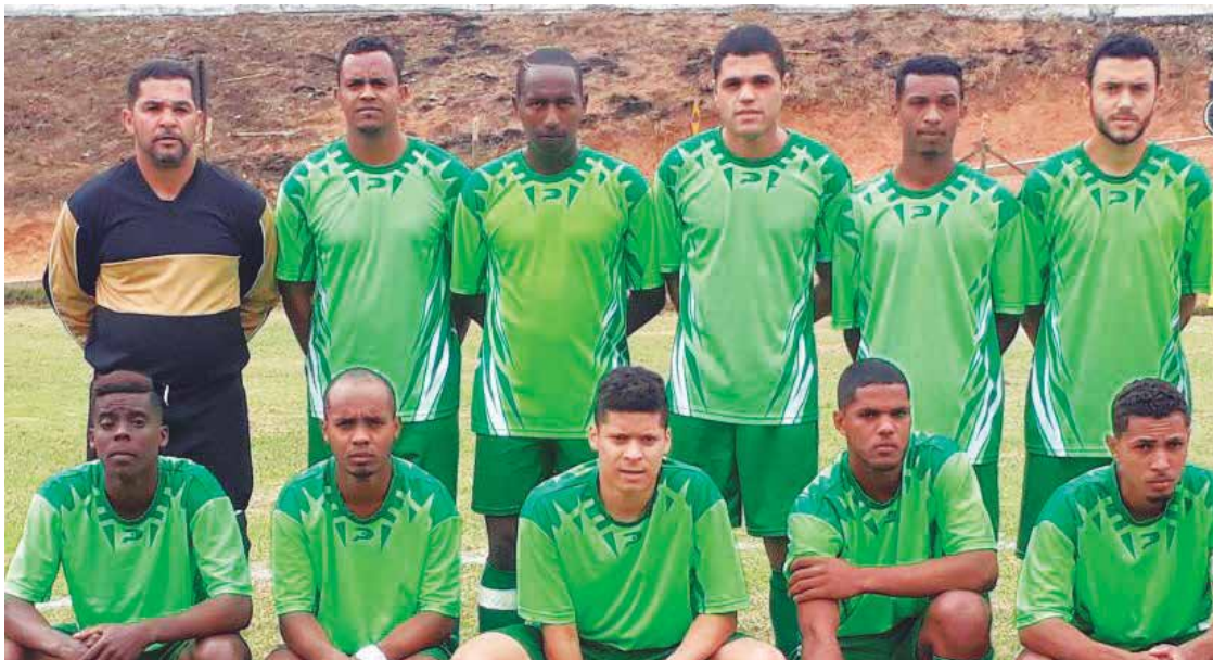
Na foto, o time Meninos da Vila.

Os jogos de volta da fase serão realizados no próximo fim de semana (7 e 8).