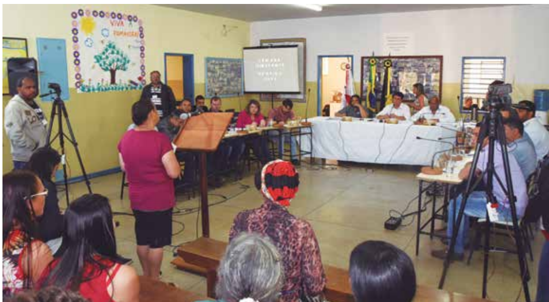
Logo após as atividades, foi realizada a reunião dos vereadores, onde a comunidade teve a oportunidade de fazer reivindicações.