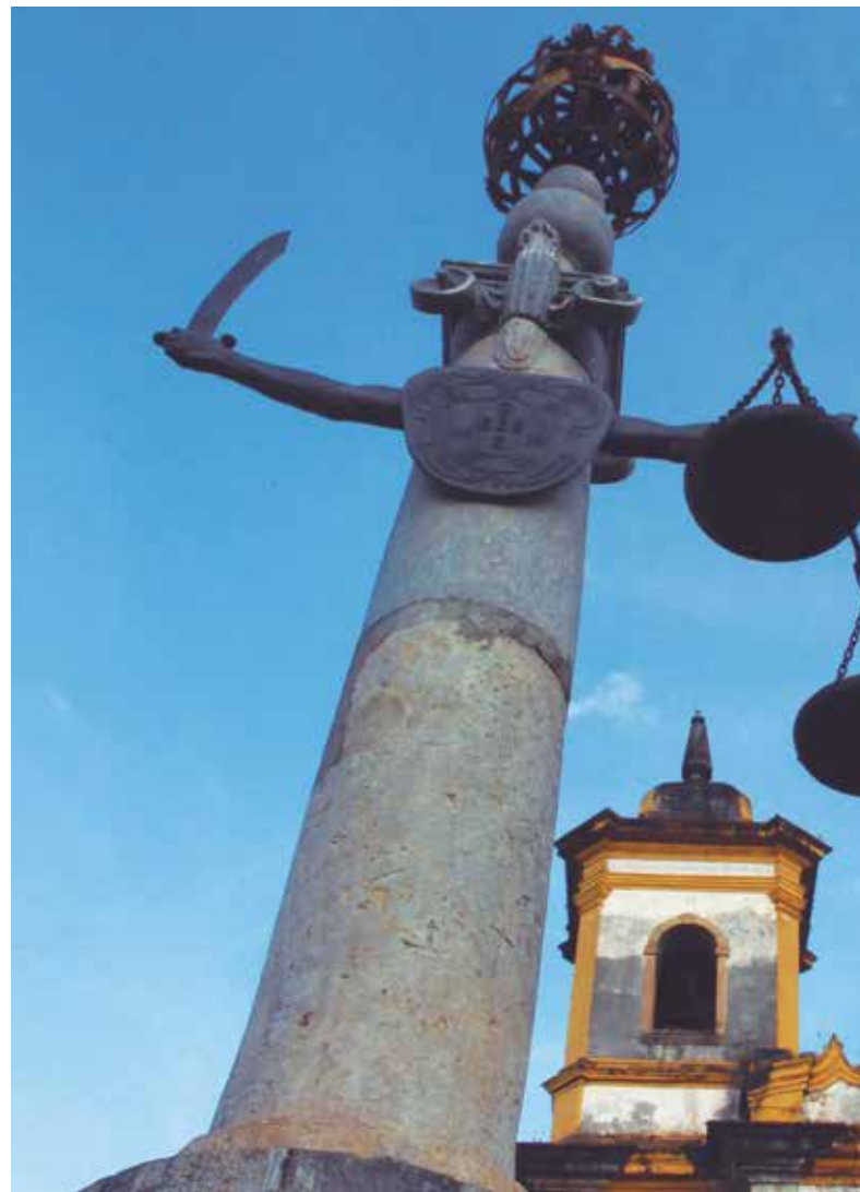
Pelourinho da Praça Minas Gerais existe há 267 anos

O mesmo instituto, no Mapa da Pobreza e Desigualdade de 2003, indicou que a incidência de pobreza na primaz de Minas é de 32,06%. Embora seja um percentual menor que em várias capitais do país, é maior que em Ouro Preto, onde a incidência registrada foi de 28,54%, que em Itabirito, 26,78%, e que na atual capital do estado, 5,43%.