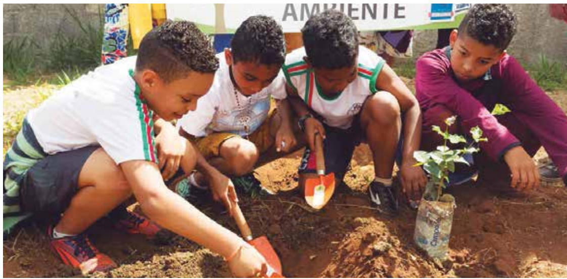
Foram plantadas mudas frutíferas.