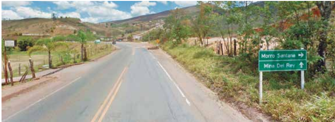
O corpo do jovem foi encontrado no bairro Morro Santana.

Na madrugada anterior à morte do adolescente, ele teria presenciado um homicídio no bairro Galego e estava apreensivo, segundo a mãe.