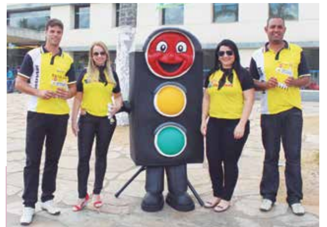
Na semana Nacional do Trânsito, a Autoescola São Cristóvão promoveu blitz educativa em campanha de conscientização. Parabéns pela iniciativa!