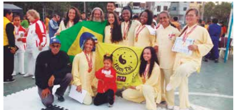
Foram 30 medalhas de ouro no total.