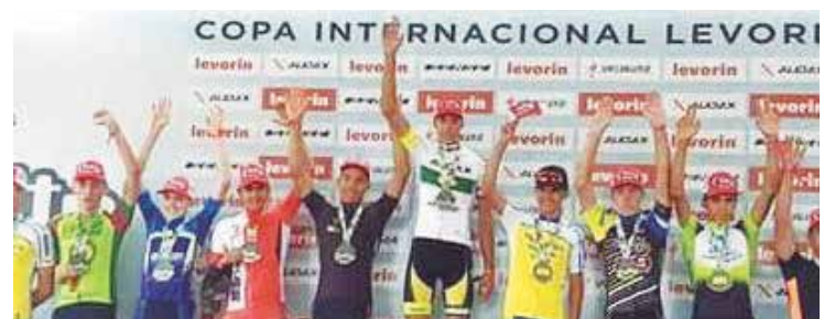
A Copa foi em realizada em São Paulo.

puta pela primeiro lugar foi levada até os últimos metros, o atleta finalizou o torneio na segunda colocação em 2017.