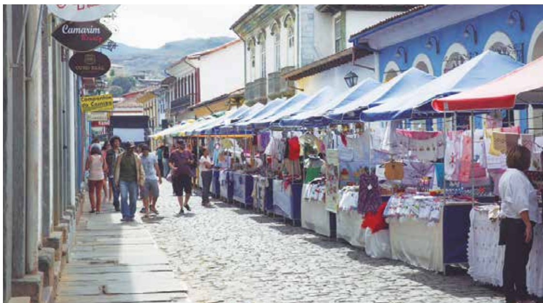
Uma grande estrutura foi montada na Rua Direita para atender a população com atividades variadas.