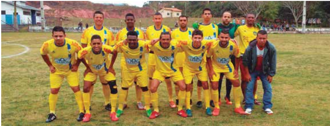
Na foto, a equipe Morro Santana.

Disputa. Três jogos da primeira divisão e dois da segunda movimentaram os gramados da cidade.