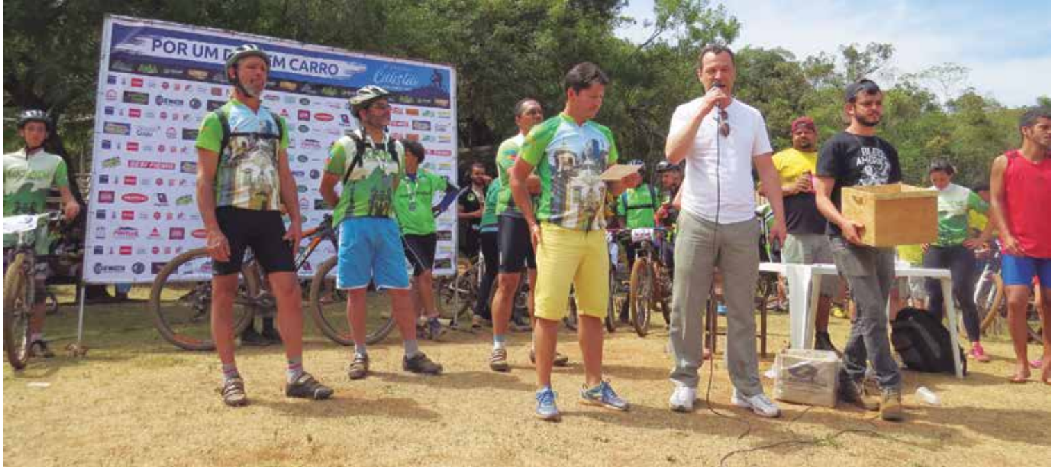
O passeio foi promovido pelo grupo Bike Vida no domingo, 24.

O prefeito ressaltou a importância de promover encontros desta ordem e disse que a Prefeitura de Ouro Preto é solidária a toda ação que vise o bem estar da população e a preservação de nossas áreas naturais.