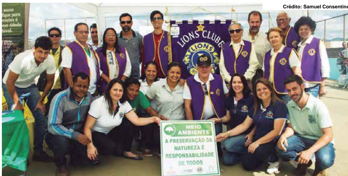
Crédito: Samuel Consentino