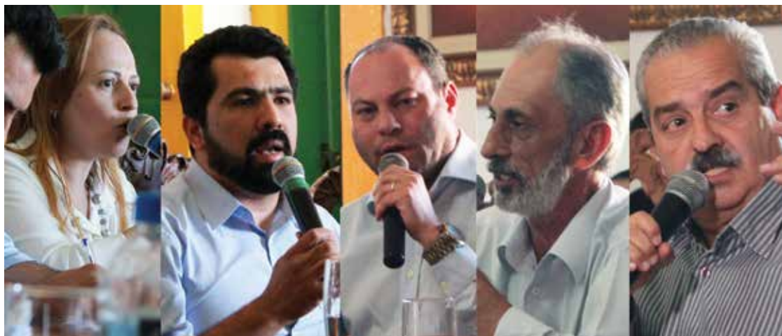
Os vereadores comentaram sobre o assunto.

A Prefeitura de Mariana foi questionada pelo Ponto Final sobre de quanto seria a economia em um eventual adiamento do JEM, mas não respondeu.