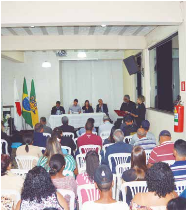
Durante a audiência a população abordou vários questionamentos.