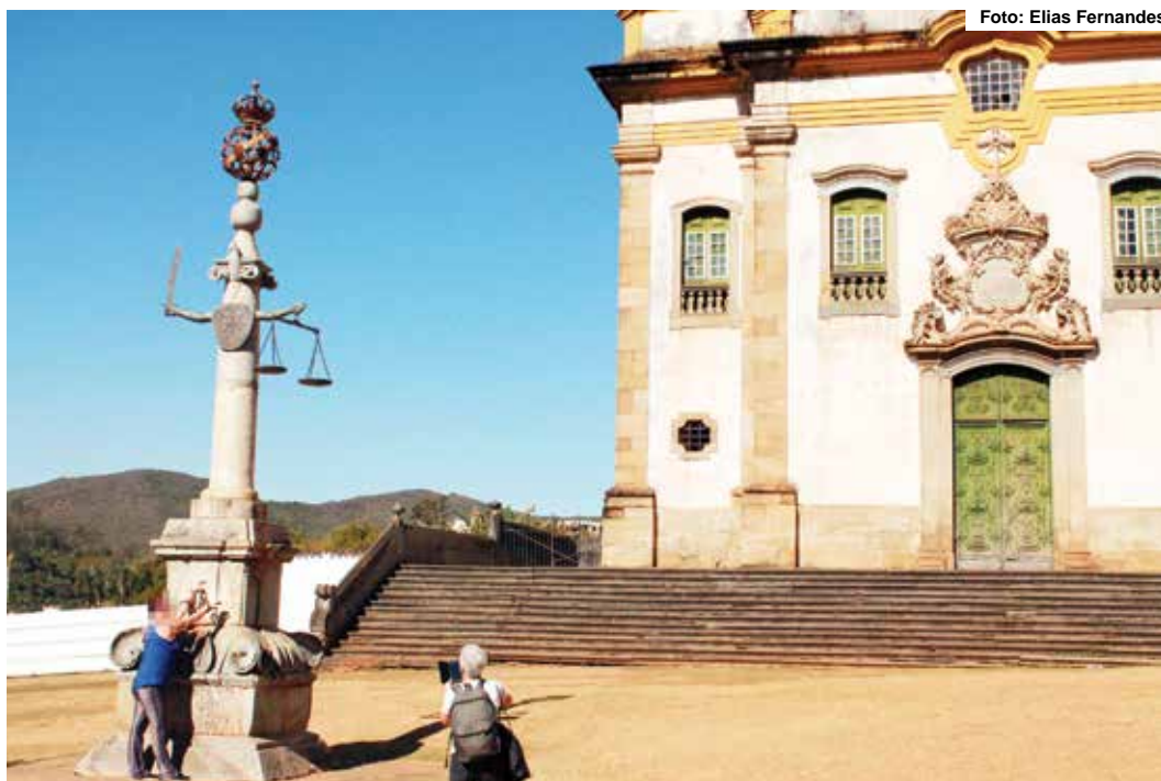
Com as mãos nas argolas, turista posa para foto no pelourinho