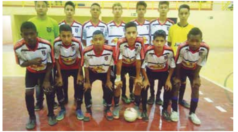
A etapa foi realizada em Conceição do Mato Dentro.