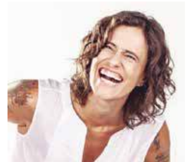
A cantora Zélia Duncan.

da Lei estadual de Incentivo à Cultura de Minas Gerais e apoio institucional das secretarias de Patrimônio, Cultura e Turismo de Ouro Preto, que também foi contemplada com os projetos, e Mariana.