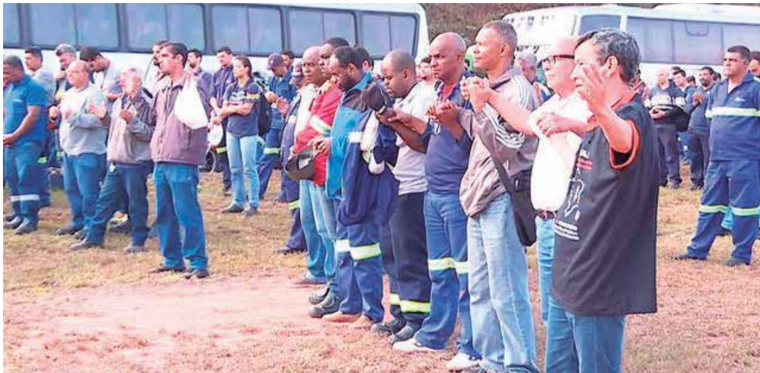
A empresa informou por meio de nota que está prestando assistência às famílias das vítimas.

Em novembro do ano passado, um acidente parecido no mesmo lugar matou três funcionários. Nessa situação, a