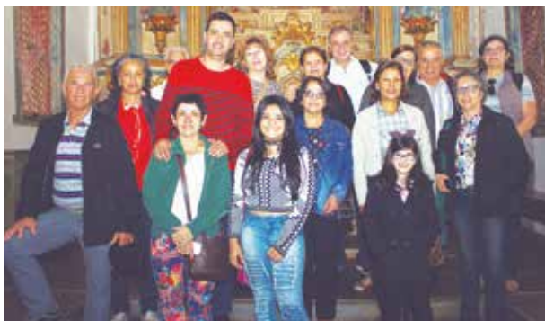
O prefeito visitou a igreja Nossa Senhora do Rosário com o pessoal da «Nave 50» durante o «Dia do Lugar» no distrito de Santa Rita Durão no último domingo.