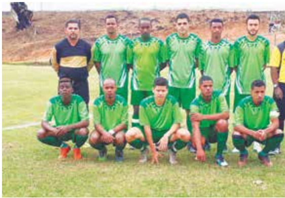
Time Meninos da Vila.