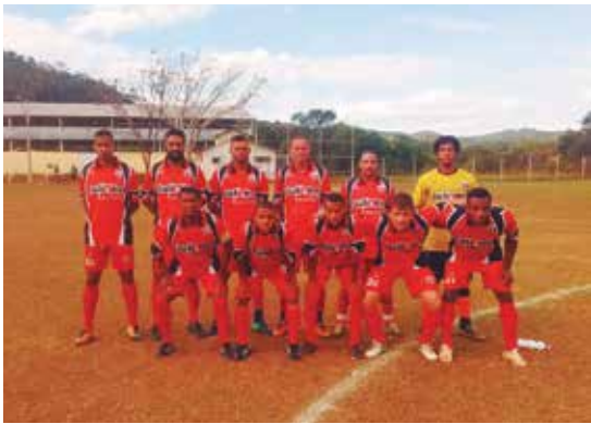
Time do Bandeirantes.