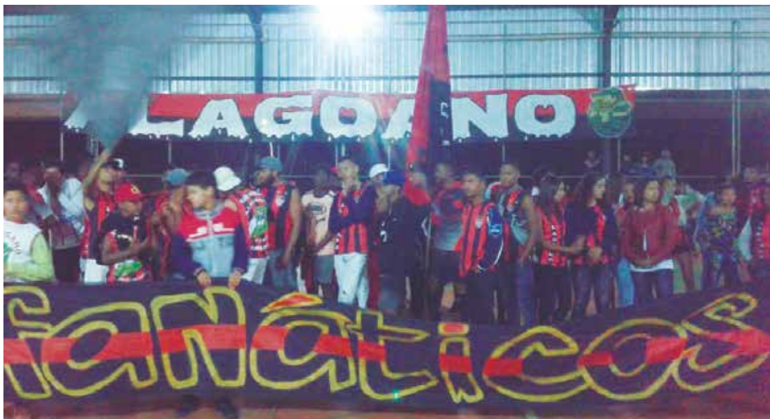
A equipe Alagoano venceu na categoria adulto.

O campeonato de futsal de Antonio Pereira e uma organização da Associação de Moradores de Antonio Pereira e do Uebert(Pi).