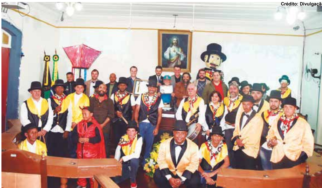
Membros do grupo e familiares de pessoas que fizeram parte da história do Zé Pereira lotaram o Plenário do Legislativo.

“A Câmara não poderia deixar passar em branco os 150 anos do Zé Pereira dos Lacaiois, uma homenagem muito bonita, na qual podemos ver praticamente quatro gerações do Club dos Lacaiois. Foi emocionante ver a Casa cheia para reverenciar o bloco. É um clube carnavalesco formado pela família ouro-pretana, temos que valorizar e preservar este que é um símbolo