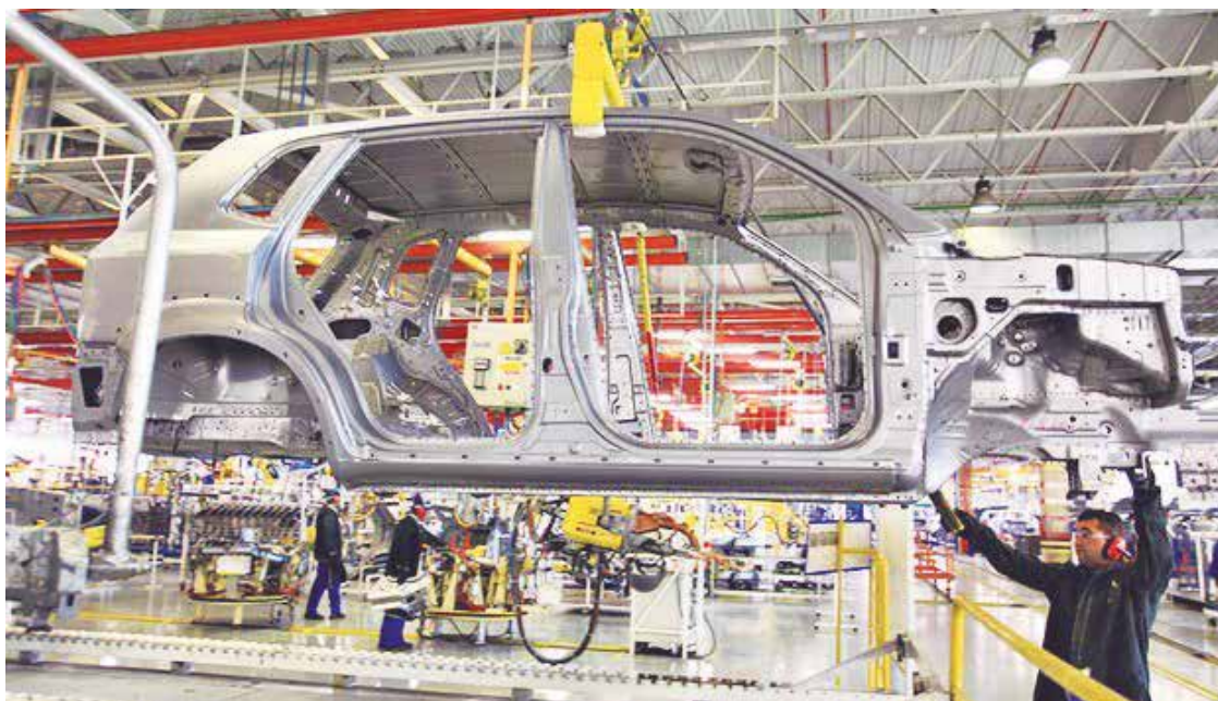
De janeiro a maio de 2016, foram produzidos 840,38 mil unidades.

Confira as 10 marcas que mais produziram no mês de