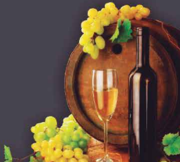
IMAGEM MERAMETE ILUSTRATIVA