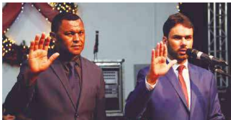
Cerca de 30% da receita de Santa Bárbara vêm da mineração.