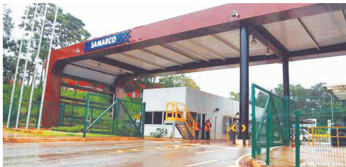
A posição da empresa até então era que a volta ocorreria no segundo semestre de 2017.