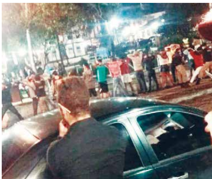
A Praça Gomes Freire foi um dos locais onde a ação foi realizada.