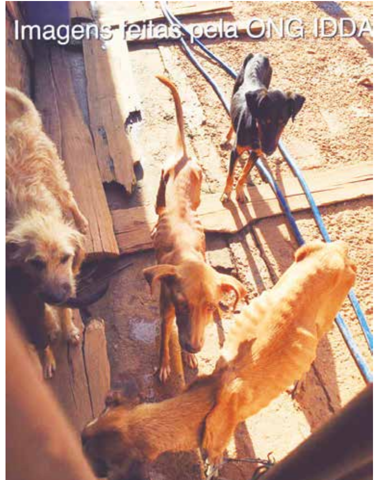
A denúncia sobre o canil foi veiculada na rede social do vereador.