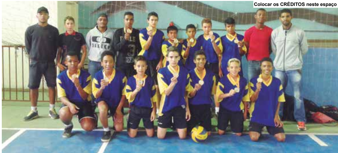
Colocar os CRÉDITOS neste espaço

A microrregional envolveu diversas modalidades.