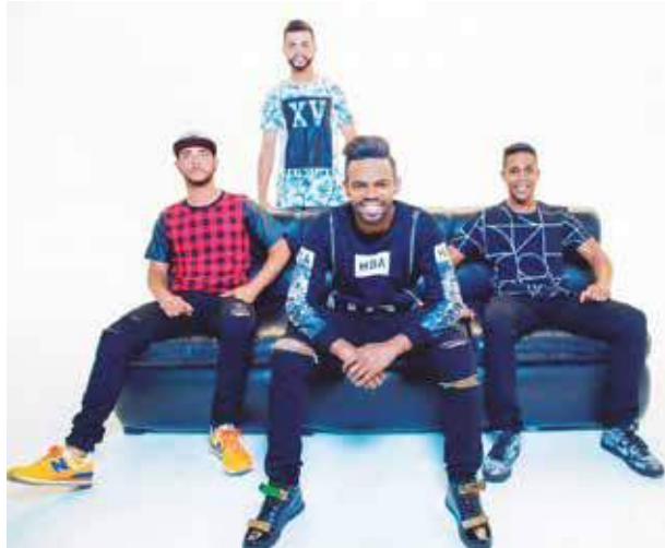
Os garotos do grupo Nozto Stylo, que é sucesso em Ouro Preto e região merece destaque também em nossa coluna! Sucesso total.