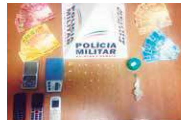
A batida policial aconteceu no bairro Barro Preto.

Os criminosos foram encaminhados para a Delegacia de Polícia Civil de plantão, junto ao material apreendido.