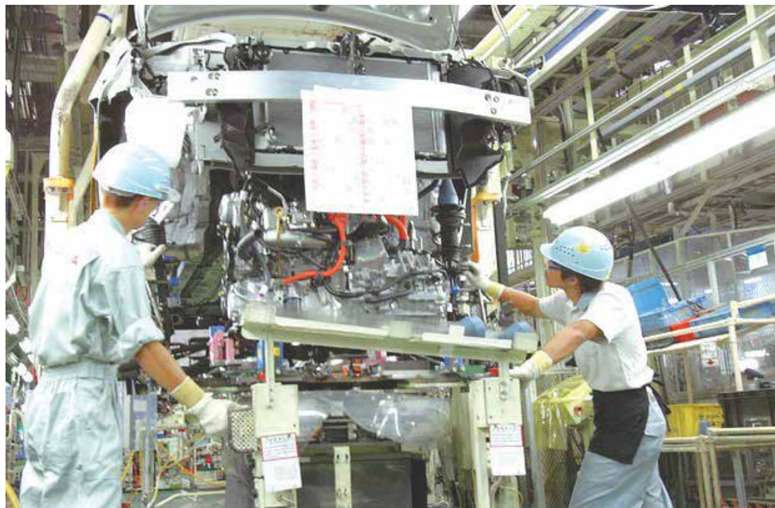
Pesquisa revelou que 183.850 automóveis foram vendidos no mês passado.