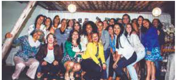
Aconteceu na sexta-feira (31/03), no Cantinho Verde em Passagem, o encontro Mulheres que inspiram. São as mulheres de Mariana mostrando garra no empreendedorismo!