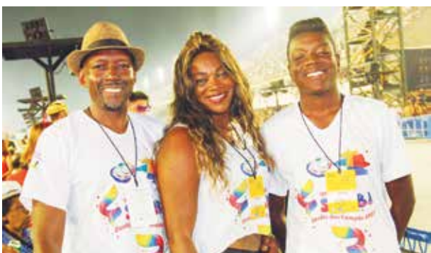
As belas fotos do desfile das campeãs no Rio de Janeiro, publicadas na edição 1092, foram feitas pela Terra Viva Produções.