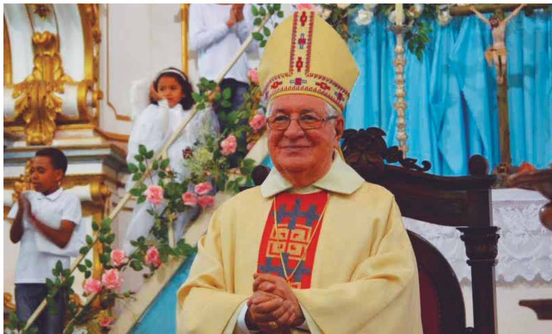
A arquidiocese não se manifestou sobre o assunto.