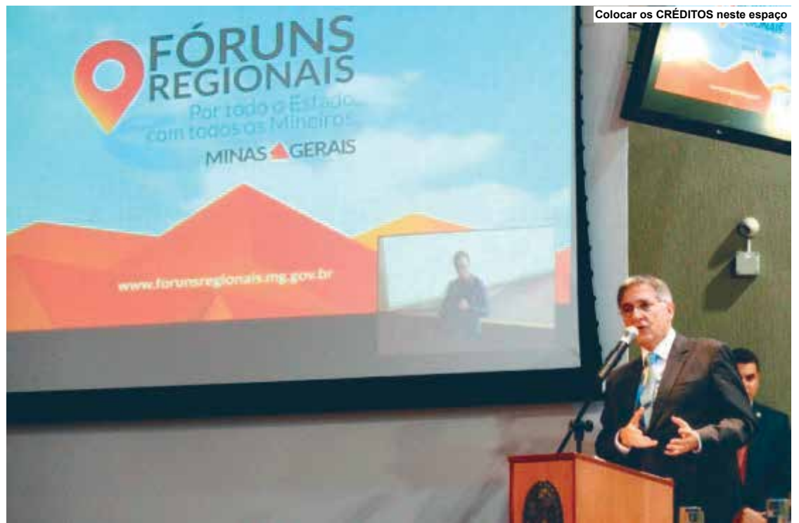
Colocar os CRÉDITOS neste espaço

Representando os 853 municípios mineiros, eles farão parte do colegiado até o final de 2018, se tornando a voz dos executivos e legislativos municipais e trazendo para os fóruns as especificidades e demandas de cada região do estado.