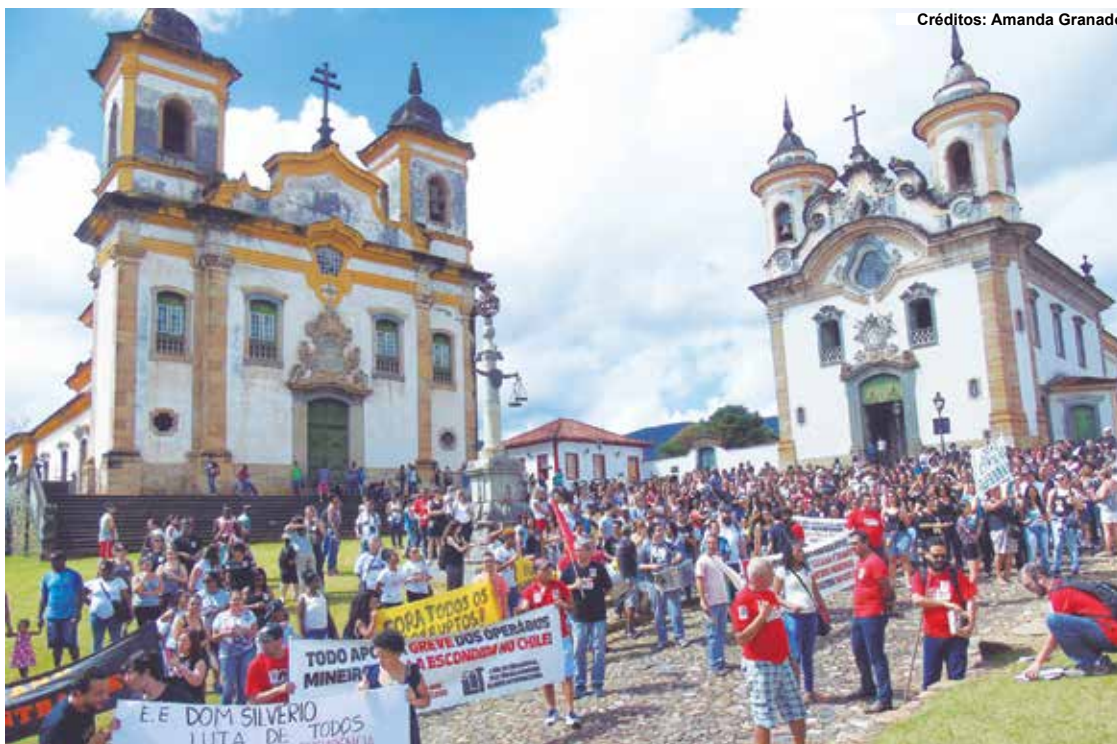
Créditos: Amanda Granado

Não foi encontrado para falar sobre o assunto.