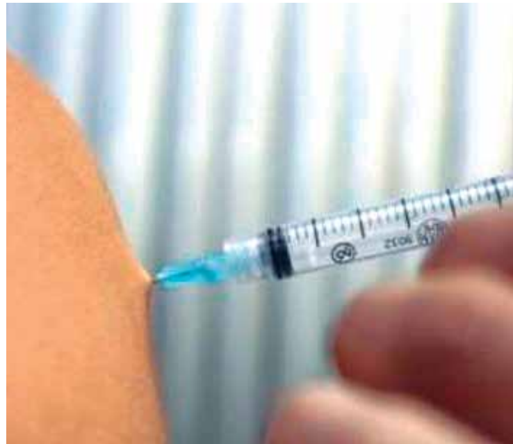
A vacina contra o vírus da hepatite B está indicada para todas as pessoas.

A Secretaria de Saúde de organizou uma programação para atendimento neste sábado (11), o dia D de vacinação. Cerca de mil pré-adolescentes,