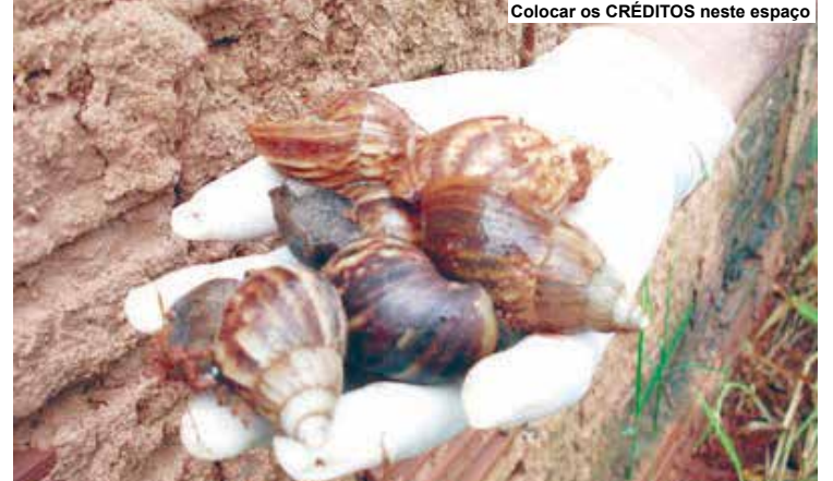
Colocar os CRÉDITOS neste espaço

O molusco acaba com as plantações nas lavouras, como amendoim, abóbora, batata-doce, feijão, mandioca, mamão, tomate e outras verduras. Flores e frutas também são devastadas com a praga.