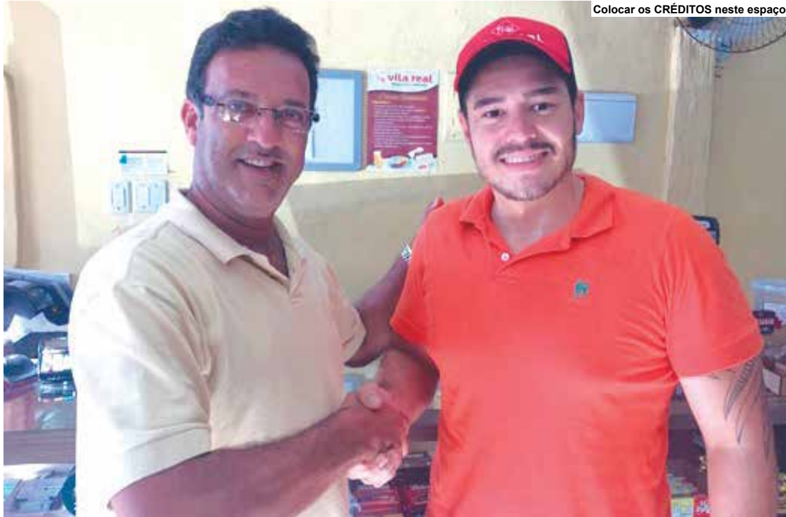
Abner levou a quantia ao escritório do empresário e fez a devolução.