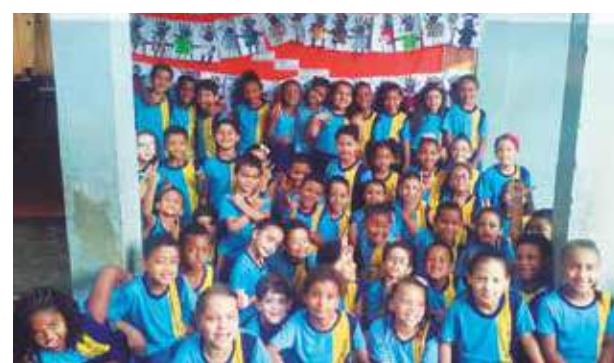
20 de novembro foi o dia da Consciência Negra. Os alunos dos primeiros anos da Escola «Dr. Gomes Freire» aprenderam a valorizar e a respeitar a cultura negra no Brasil e ver como foi grandiosa a influência dos negros na cultura brasileira.