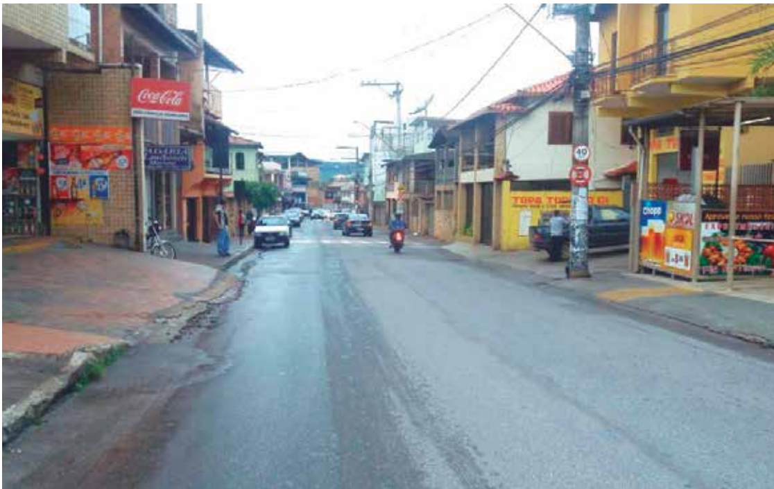
O Túnel Bala está localizado na Avenida Nossa Senhora do Carmo.

O Ponto Final procurou a Procuradoria do Município, que não quis pronunciar sobre o assunto.