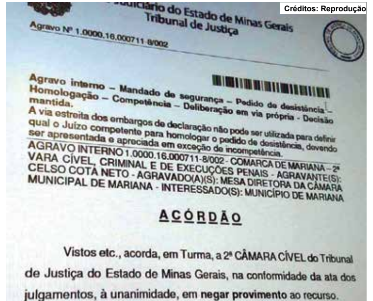
Publicação da decisão sobre o recurso de Celso Cota.

Foi julgado, na tarde de ontem, o agravo regimental nº0007118-34.2016.8.13.0000,