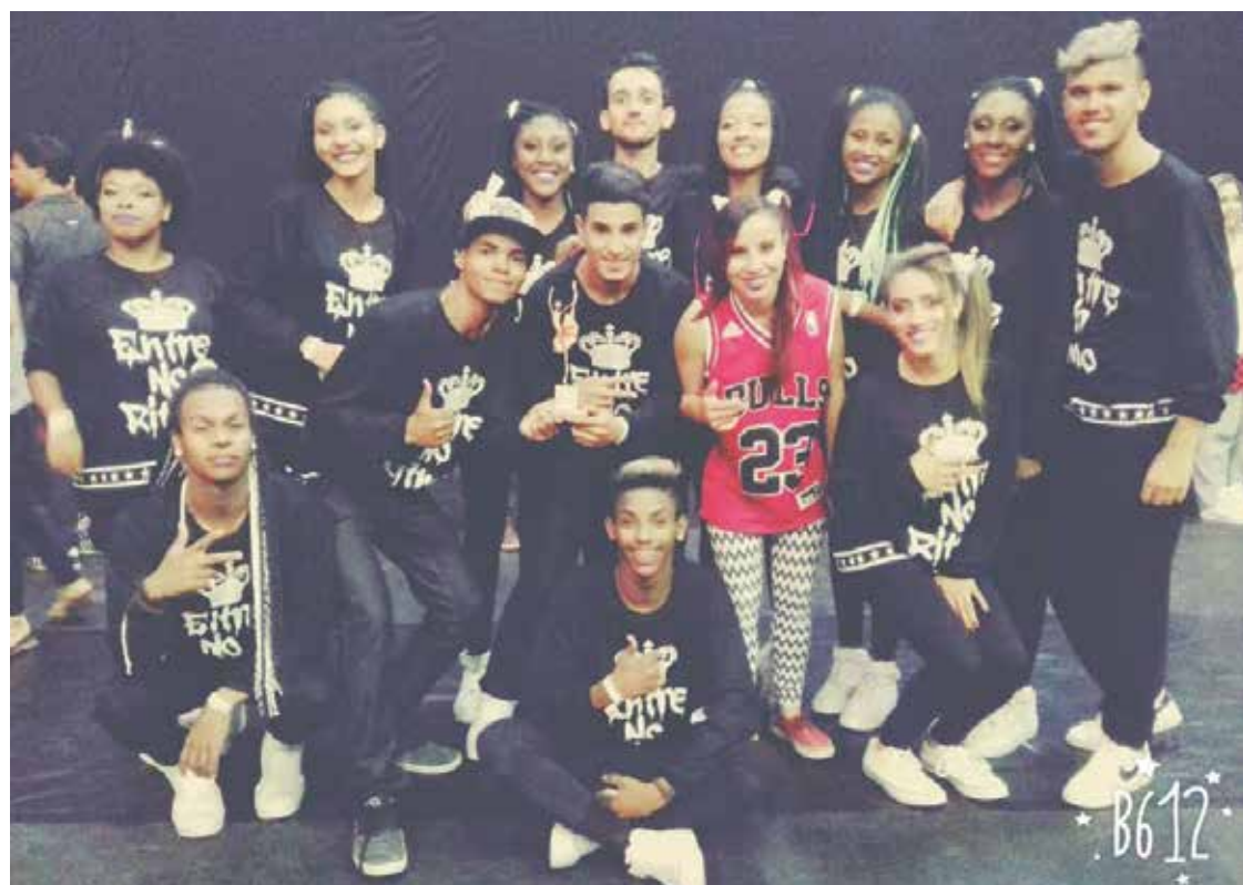
O grupo Cia Entre no Ritmo.