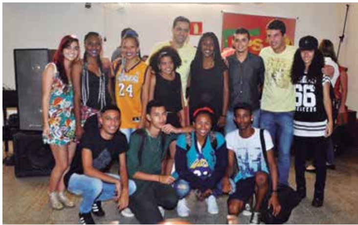
O evento reuniu diversos apoiadores entre militantes e lideranças mundiais.