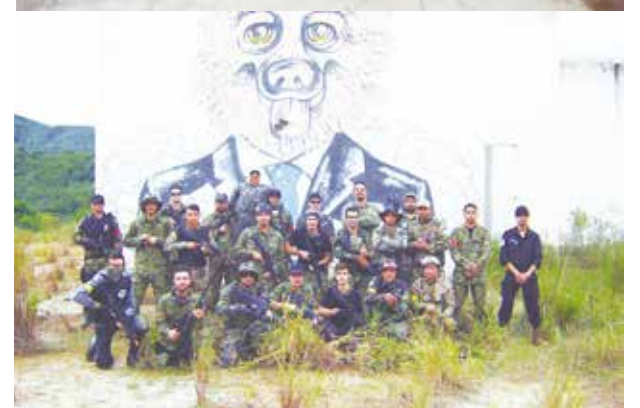
A equipe de Airsoft de Mariana. «Delta Force Airsoft» recebeu as equipes das cidades de Conselheiro Lafaiete, Itabirito e Ouro Branco