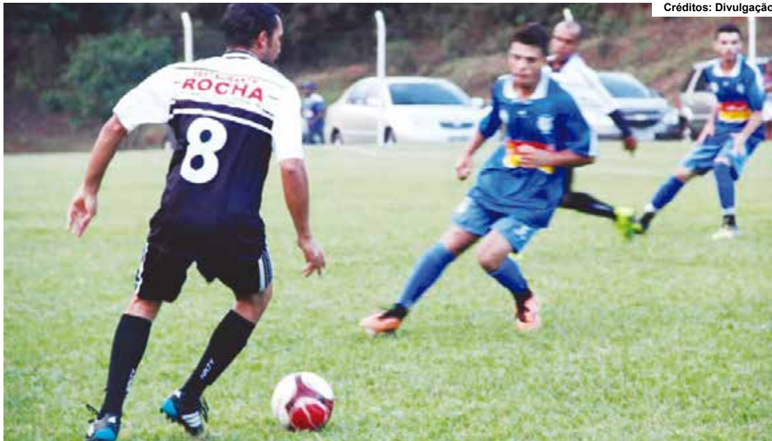
Os 17 clubes esportivos de Mariana que receberão o repasse estão regulares e com inscrição na Liga Esportiva da cidade.

beram a subvenção: Independente Futebol Clube; Colômbia Futebol Clube; Engenho Futebol Clube; Futebol Clube São Caetanense; Guarany Futebol Clube; Olympic Sport Clube; 08 de Dezembro Futebol Clube; Associação Atlético Juma; Bandeirantes Futebol Clube; Barro Branco Futebol Clube; Esporte Clube 29 de Junho; Goiabeiras Futebol Clube; Grupo de Amigos Santo Antônio; Ideal Esporte Clube; Morro Santana Esporte Clube e União Passagens Futebol Clube.